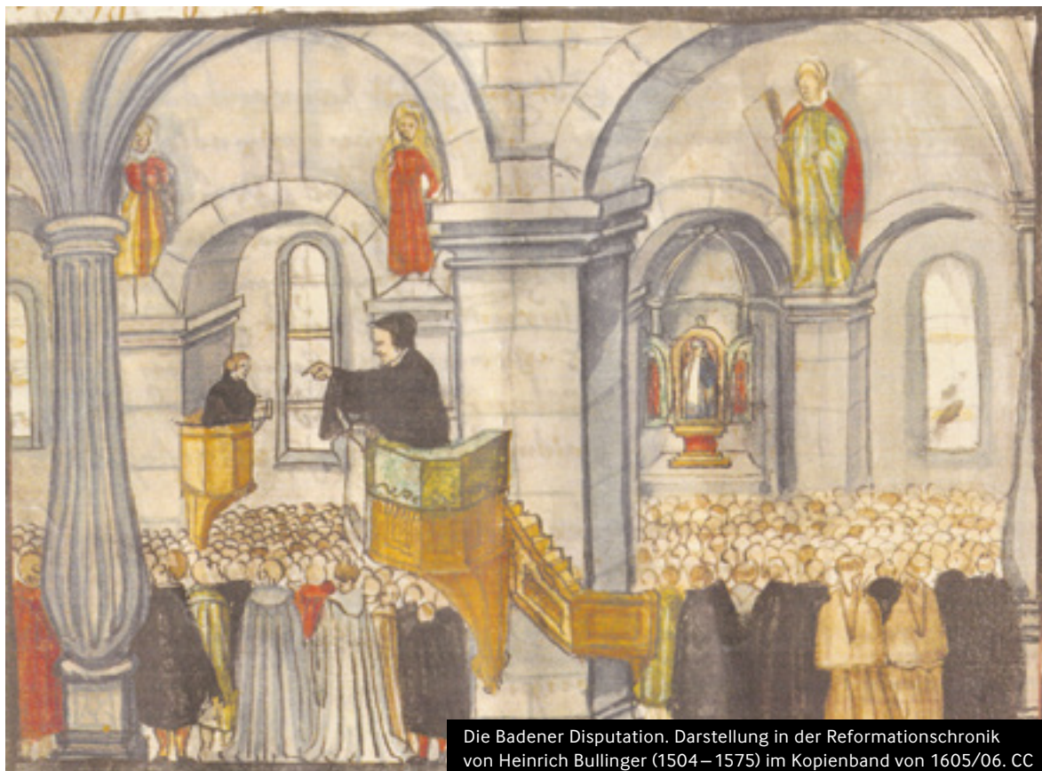
Die Badener Disputation. Darstellung in der Reformationschronik von Heinrich Bullinger (1504–1575) im Kopienband von 1605/06. CC

GESCHICHTE Die Stadt Baden feiert die nächsten Monate mit einem vielseitigen Programm das Jubiläum 500 Jahre Disputation. Das kirchliche Happening von 1526 sendet gerade für die Gegenwart mit ihrer Krise der Demokratie wichtige Impulse aus.