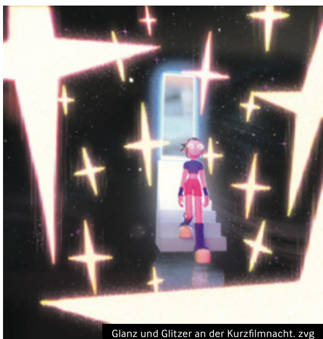
Glanz und Glitzer an der Kurzfilmnacht.