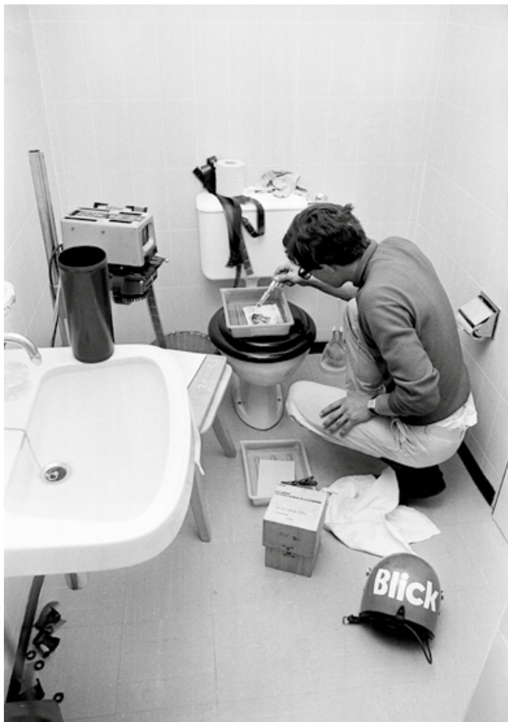
Improvisiertes Fotolabor in einer Toilette während der Tour de Suisse 1968.