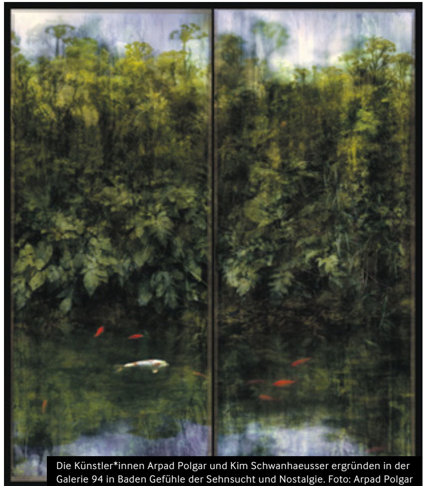
Die Künstler*innen Arpad Polgar und Kim Schwanhaeusser ergründen in der Galerie 94 in Baden Gefühle der Sehnsucht und Nostalgie. Foto: Arpad Polgar