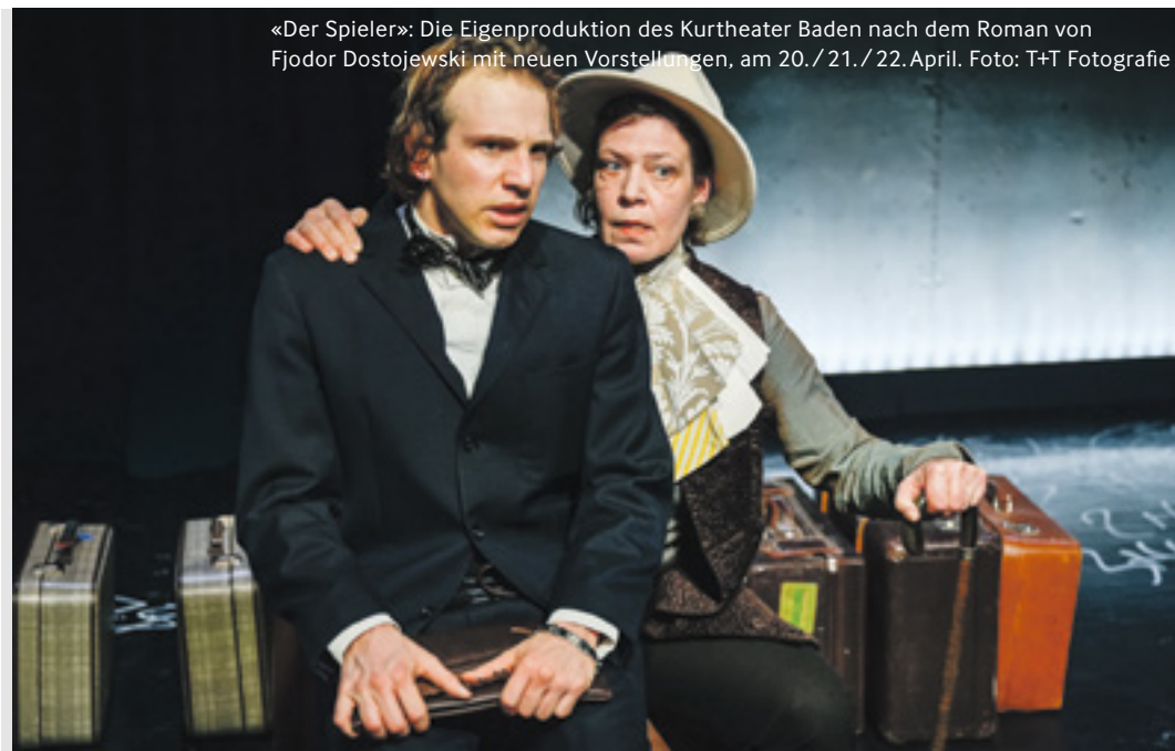
«Der Spieler»: Die Eigenproduktion des Kurtheater Baden nach dem Roman von Fjodor Dostojewski mit neuen Vorstellungen, am 20./21./22. April.