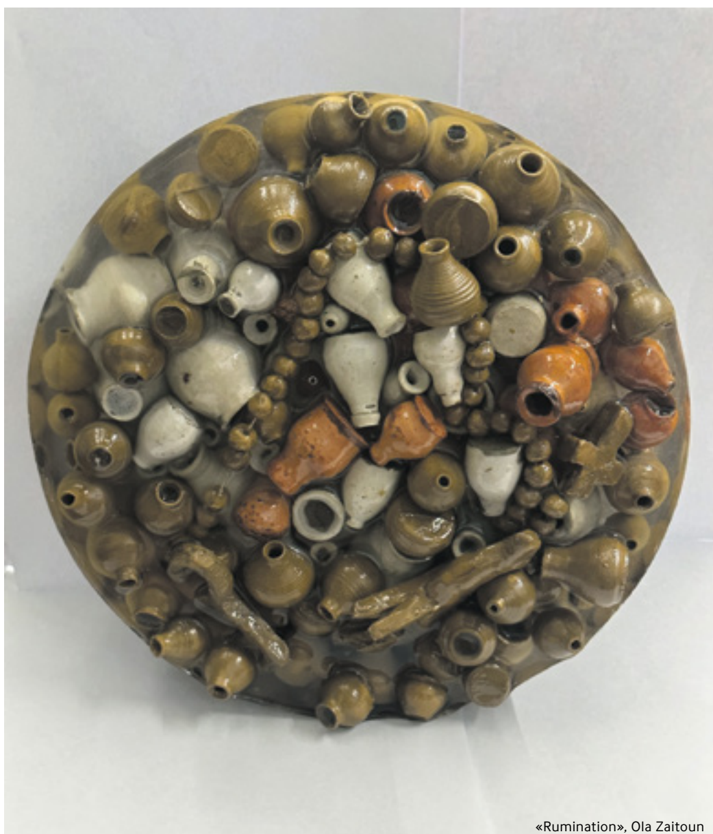
«Rumination», Ola Zaitoun

Mein aktuelles Projekt nimmt noch Gestalt an, und ich ziehe es vor, es frei wachsen zu lassen, fernab von Aufsicht und Druck. Ideen brauchen Raum, um sich zu entwickeln, und Kunst braucht Schutz, bevor sie das Licht der Welt erblicken kann.