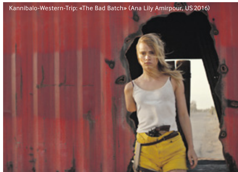
Kannibalo-Western-Trip: «The Bad Batch» (Ana Lily Amirpour, US 2016)

Und auch wenn Schwarzeneggers Schauspielkünste gelegentlich diskutiert werden – gerade das Overacting und die archetypischen Charaktere verleihen dem Werk seinen ikonischen Charme.