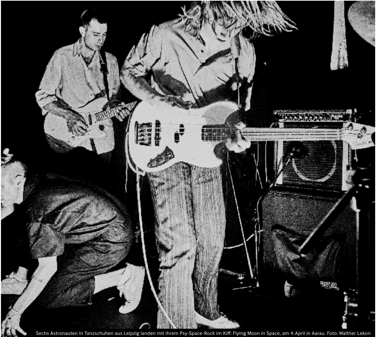
Sechs Astronauten in Tanzschuhen aus Leipzig landen mit ihrem Psy-Space-Rock im Kiff: Flying Moon in Space, am 4. April in Aarau.