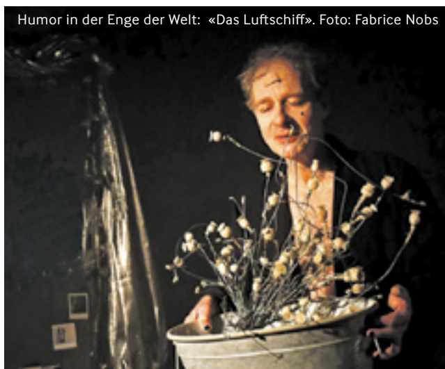
Humor in der Enge der Welt: «Das Luftschiff».

BREMgarten Kellertheater, Sa, 18. April, 20.15 Uhr