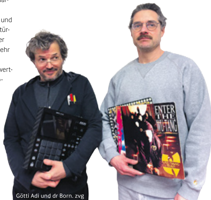
Götti Adi und dr Born.

Nächste Ausstrahlung: Donnerstag, 9. April, 21 Uhr