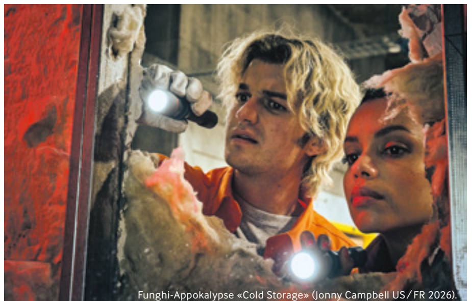
Funghi-Appokalypse «Cold Storage» (Jonny Campbell US/FR 2026).

Für reichlich Splatter und ebensoviel Lacher sorgt auch Jonny Campbells neuestes Werk «Cold Storage» (US/FR 2026). Die Mittdreissiger Teacake (Stranger-Things-Liebling Joe Keery) und Naomi (Barbarian-Star Georgina Campbell) schieben Nachtschicht in einer unscheinbaren Self-Stora-