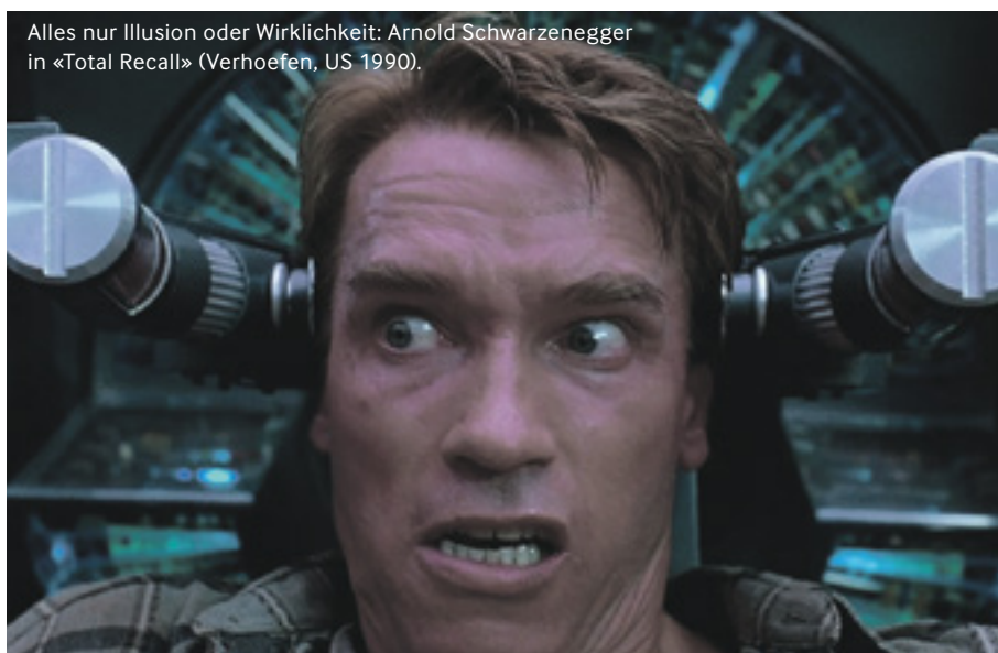
Alles nur Illusion oder Wirklichkeit: Arnold Schwarzenegger in «Total Recall» (Verhoeven, US 1990).

So nimmt uns der Science-Fiction-Kultfilm «Total Recall» (US 1990) von Paul Verhoeven mit ins Jahr 2084. Bauarbeiter Douglas Quaid (Arnold Schwarzenegger) träumt vom Mars, eine Reise dorthin liegt allerdings nicht drin. Kurzum entscheidet er sich für einen virtuellen Urlaub auf dem roten Planeten – in der Rolle eines Geheimagenten. Doch es kommt zu Komplikationen, und plötzlich wird er von Attentätern verfolgt. So flieht er nun auf den echten Mars, wo er auf Aufstandskämpfer*innen trifft, die sich gegen einen Megakonzern zur Wehr setzen, der die Bewohner*innen unterdrückt und den Planeten ausbeutet. Neben spektakulären Spezialeffekten und brutalen Actionsequenzen entfaltet «Total Recall» eine deutliche Kritik an übermächtigen Unternehmen und neoliberalen Machtstrukturen.