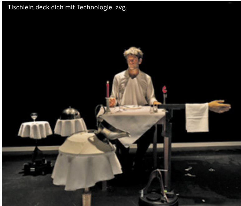
Tischlein deck dich mit Technologie.