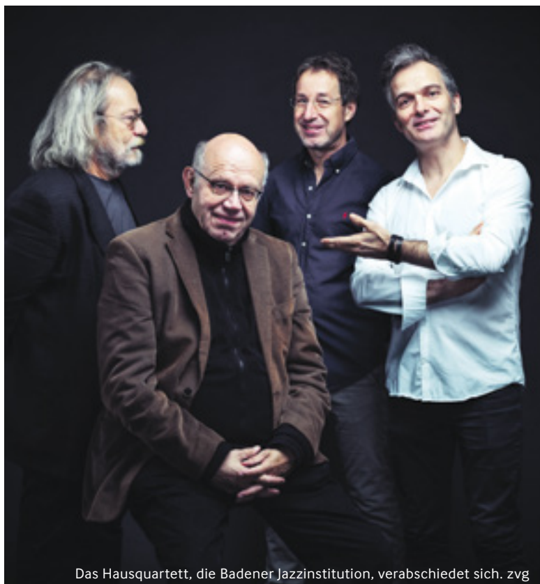
Das Hausquartett, die Badener Jazzinstitution, verabschiedet sich.

BADEN Stanzerei, Do / Fr, 9. / 10. April, 20.15 Uhr