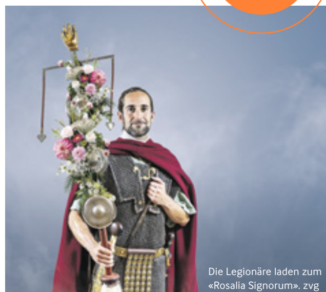
Die Legionäre laden zum «Rosalia Signorum».

WINDISCH Legionärspfad, So, 12. April, 10 Uhr