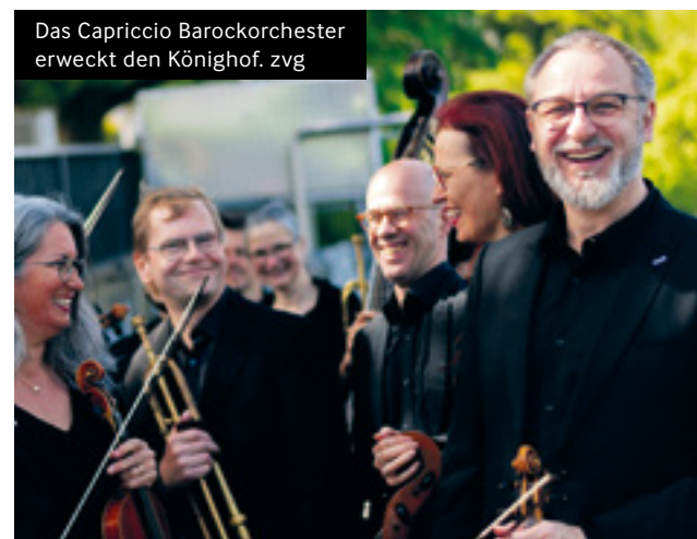
Das Capriccio Barockorchester erweckt den Königshof.

WINDISCH Klosterkirche Königsfelden, Sa, 18. April, 19.30 Uhr